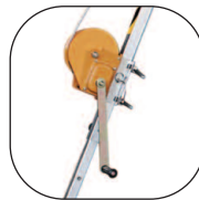
Repuesto torno 25 m Ref. 80378