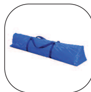
Repuesto mochila Ref. 80123